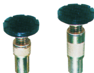
Przedłużenia dla stopnic podprogowych